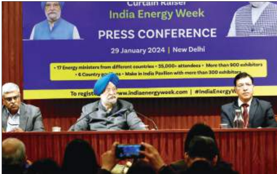
केंद्रीय पेट्रोलियम मंत्री हरदीप सिंह पुरी इंडिया एनर्जी वीक पर प्रेस कॉन्फ्रेंस को संबोधित करते हुए

टीम एक्शन इंडिया/लखनऊ भारत निर्वाचन आयोग ने 56 राज्यसभा सीटों पर चुनाव की घोषणा कर दी है। देश के 15 राज्यों की 56 राज्यसभा सीटों पर 27 फरवरी को मतदान होगा। इनमें सर्वाधिक दस सीटें उत्तर प्रदेश की हैं। चुनाव आयोग के अनुसार 15 फरवरी तक नामांकन पत्र दाखिल होंगे। नाम वापस लेने की अंतिम तिथि 20 फरवरी है। 27 फरवरी को सुबह नौ बजे से शाम चार बजे तक मतदान होगा। मतों की गिनती 27 फरवरी को ही शाम पांच बजे से होगी।