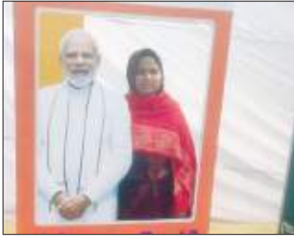
विकसित भारत संकल्प यात्रा के दौरान आयोजित कार्यक्रम में पीएम मोदी के फोटो के साथ फोटो खिंचवाती हुई लाभार्थी।